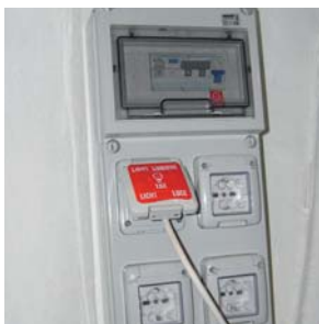
Fig.01 Pic. 01

Automatic juicer. Adaptable for models and systems Zummo Z14 (Pic.02) and Z06 Transport trailer. (Pic.03) *Consult ref. and price.