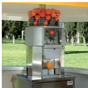
Fig.02 Pic. 02