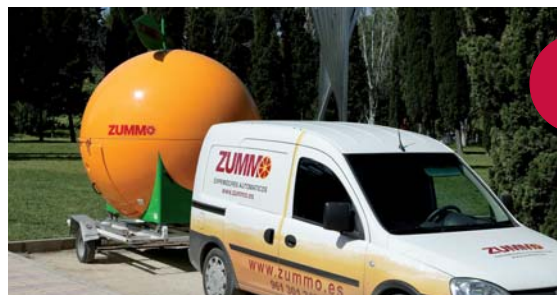
Fig.03 Pic. 03